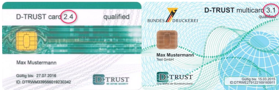
Abb. 2: Versionsnummer auf D-Trust Signaturkarten

Der Grund dafür, dass die Karten auslaufen, ist, dass die Signaturkarten dann nicht mehr den Sicherheitsanforderungen der Bundesnetzagentur genügen und gesperrt werden müssen. Alle betroffenen Kunden wurden laut D-Trust persönlich per E-Mail und Post informiert. Die D-Trust schickt Ihnen automatisch eine Austauschkarte zu, falls Sie nicht bis 14 Tage nach dem Erhalt der postalischen Ankündigung des Austauschs Ihrer Karte widersprechen. Außerdem wird Ihnen in der neuen NSUITE-Version 2.14 eine Meldung angezeigt, dass Ihre Karte zum Jahresende ausläuft.